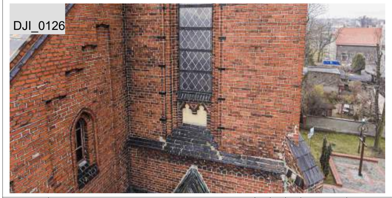
S-DJI_121145_PO-02 Nowe cegły klinkierowe jak i cegły zniszczone do usunięcia i zastąpienia cegłami półklinkierowymi dedykowanymi na inwestycję